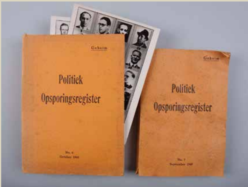
Register van personen opgepakt in verband met collaboratie.

Ondanks het mildere optreden van Feitsma ontloopt hij zijn straf niet. De ex-burgemeester zit na de oorlog dik anderhalf jaar vast voor het samenwerken met de vijand. Feitsma overlijdt op 65-jarige leeftijd op 31 januari 1953.