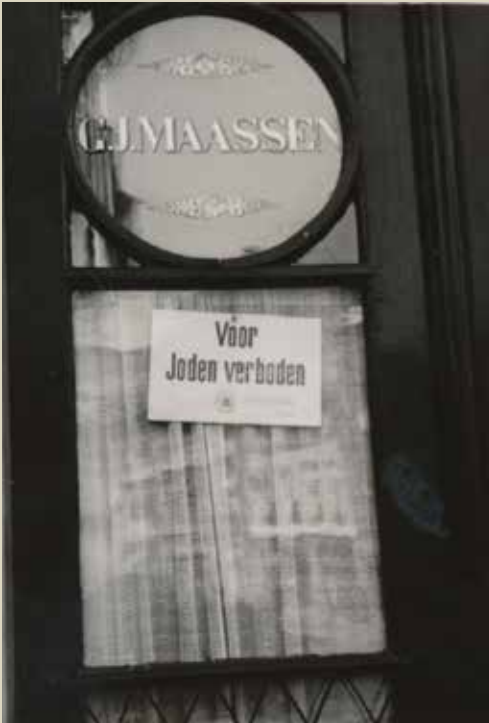
Bordje voor raam van winkel.