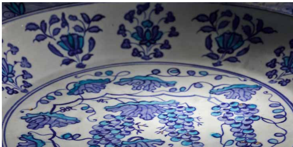
Schotel met druiven, bloemtakken en golven, ca. 1530. Keramiekmuseum Princessehof, Leeuwarden, bruikleen De Ottema-Kingma Stichting.

van 44,5 centimeter is dit de grootste Iznik schotel met druivenmotief die wereldwijd bekend is. Het topstuk werd door de OKS aangekocht bij veilinghuis Sotheby's in Londen en is tot en met 20 augustus 2023 te zien in de tentoonstelling Feest! , waarna het een plek krijgt in de vaste presentatie Van Oost en West .