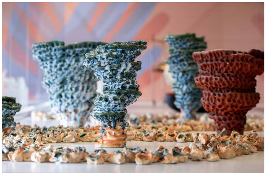
Handle with Care, foto's door Ruben van Vliet