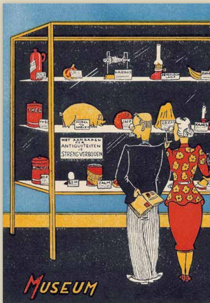
Naoorlogse spotprent over de voedselsituatie tijdens de oorlogsjaren.