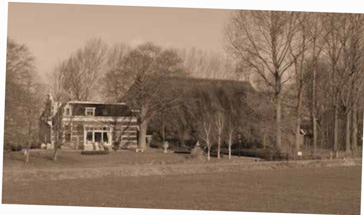
Boerderij in Cornjum waar Geesje zat.

In de tijd dat we in Friesland zaten, wisten we niets van thuis. Treinen reden niet en post kwam niet aan. We hadden goed eten. Er was alleen geen zeep. Je had van die imitatiezeep. Het was net lucht, maar je deed het ermee. Er waren allemaal boeren in de omgeving. De een gaf aardappelen en de ander groenten of melk. Je kon bijna alles in Friesland krijgen. Ik ben twee jaar in Jelsum gebleven en ging in 1946 weer naar huis.