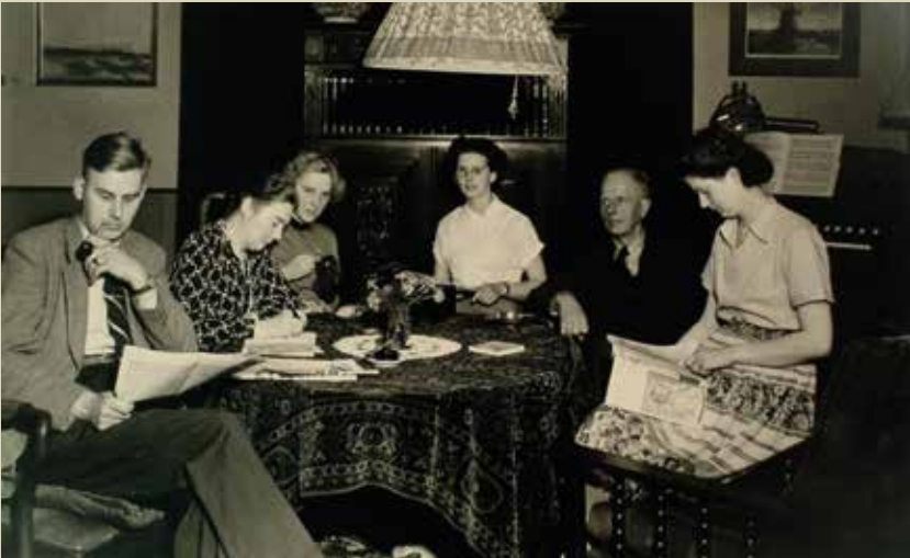
De familie Hofstra.

's Avonds na 10 uur niet meer op straat. De Duitsers halen de fietsen uit de winkels en als ze betalen doen ze het met Duits geld.