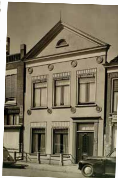
Woonhuis familie Hofstra in Sneek, Wijde Noorderhorne 15

Zo'n 40 à 50 man zijn in Sneek gearriveerd om de klokken uit 't klokkenhuis op te halen. De klokken van omstreeks 1570!