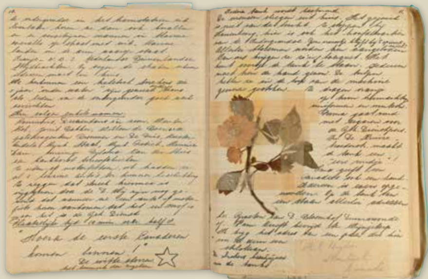
Pagina uit een van de oorlogsschriften.

Bijna alle treinen vallen uit. Van Stavoren - Leeuwarden rijdt alleen de boottrein nog. Schooltreinen zijn dus ook uitgevallen. Brieven kan men niet meer laten aantekenen.