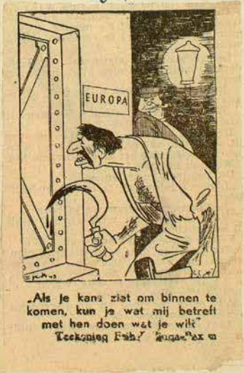
„Als je kans ziet om binnen te komen, kun je wat mij betreft met hen doen wat je wilt” Teekenaar: Fish? Kuba, '43