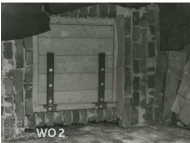
Luik, dat toegang tot een schuilplaats gaf.

Met de antwoorden op deze deelvragen ontstond langzaam maar zeker een totaalbeeld van de sterke en minder sterke kanten van Friesland als veilige haven voor Joodse onderduikers.